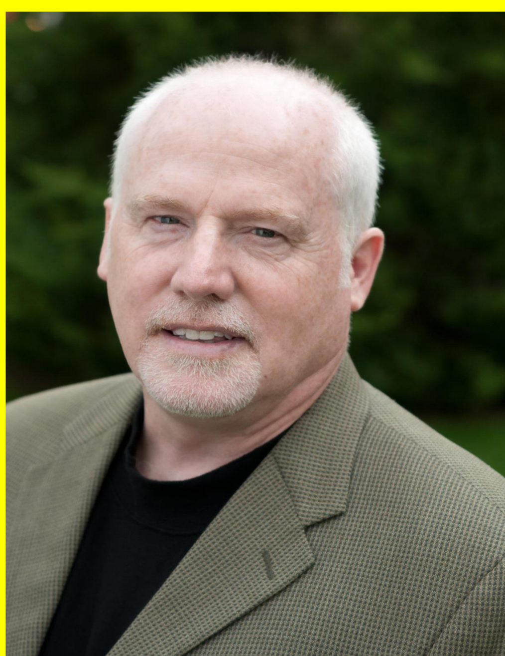
ALEX NEVE SECRÉTAIRE GÉNÉRAL AMNISITIE INTERNATIONAL